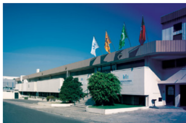
Instalações da Sidefarma